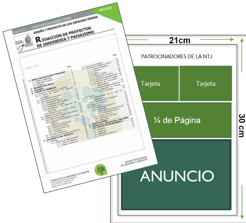
Anuncio 1/2 página (15cm x 11,5cm)